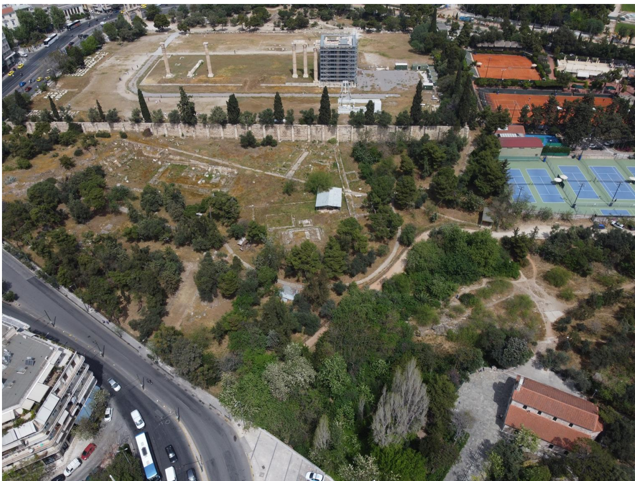
Η αρχαία κοίτη του Ιλισού “κρυμμένη” δίπλα στον ναό του Ολυμπίου Διός

Δυστυχώς, παλαιότερη πρόταση να αποκαλυφθεί ένα μικρό αλλά σημαντικό πολιτιστικά μέρος του Ιλισού που θα περιλαμβάνει το μόνο ορατό σημείο της αρχαίας κοίτης δίπλα στο Παναθηναϊκό στάδιο, φαίνεται ότι κρίθηκε “μη ρεαλιστική”.