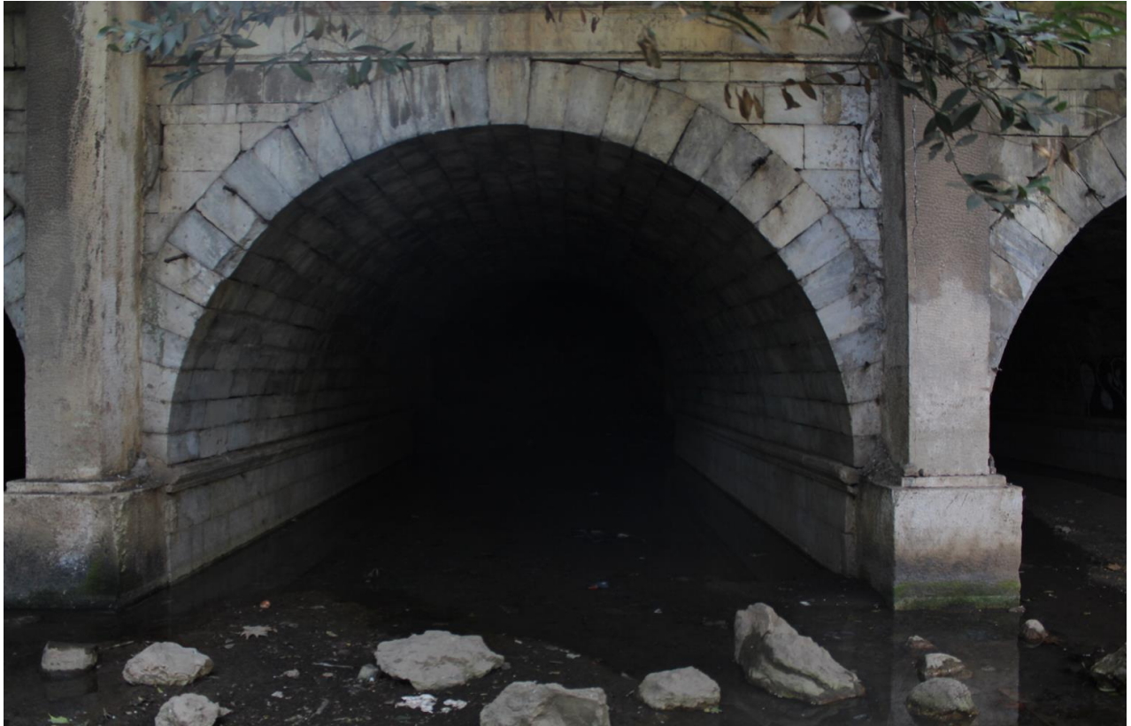
Άποψη από την τρίτοξη γέφυρα του ποταμιού στο σημείο που έχει μείνει ακάλυπτο, αλλά εγκαταλειμμένο και βρώμικο