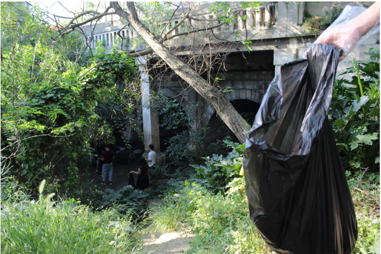
Η αποκάλυψη του Ιλισού ίσως να μην πραγματοποιηθεί, ωστόσο το "ζωντανό" του τμήμα πρέπει να διατηρείται καθαρό και να αναδειχθεί