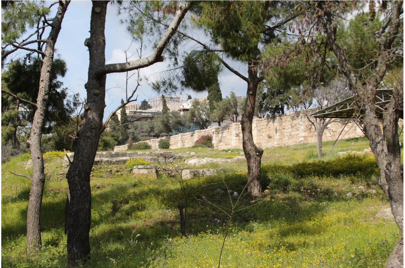
Η θέα στην Ακρόπολη και το τείχος στο Ολυμπεϊό. Εκεί βρισκόταν το Πύθιο, η κρήνη Καλλιρρόη, αλλά και το Κυνόσαργες